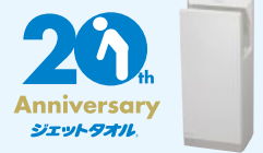
ハンドドライヤー ジェットタオル