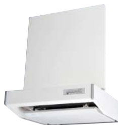
<幅600mmタイプ> V-6027SL-BL V-6037SL-BL V-6047SL-BL V-6027SSW-BL V-6037SSW-BL V-6047SSW-BL V-6037S-BL V-6047S-BL <幅750mmタイプ> V-754S <幅900mmタイプ> V-904S