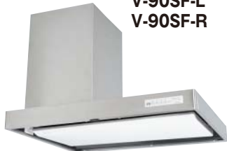
<幅900mmタイプ> V-90SF-L V-90SF-R